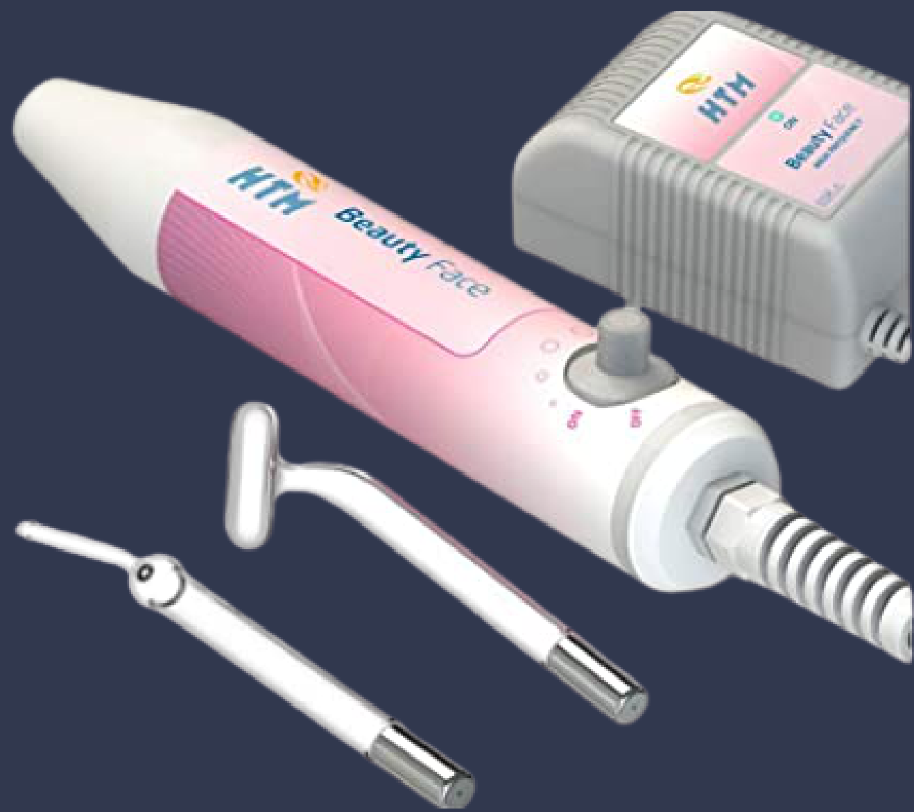
Alta frequência HTM portatil