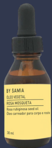
Óleo vegetal de Rosa Mosqueta

O óleo de rosa mosqueta é tradicionalmente conhecido por suas propriedades terapêuticas, pelo grande poder regenerador de pele, por ser natural e sem conservantes ou químicas agressivas, podem ser usados em todas as idades. Ele possui uma combinação como propriedades anti inflamatória e antioxidante, auxiliando no combate às oxidações e estresse da pele. Usado principalmente do pós depilatório.