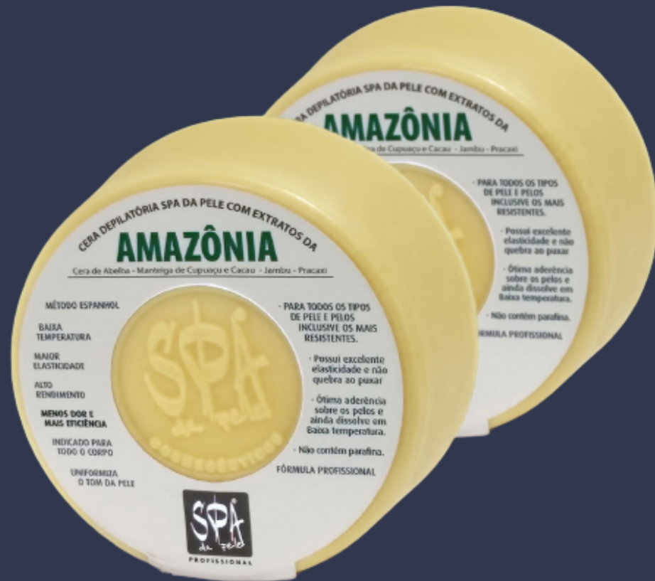
CERA MÉTODO ESPANHOL