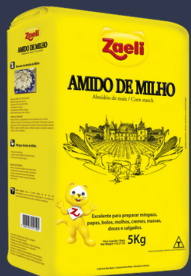
Amido de milho