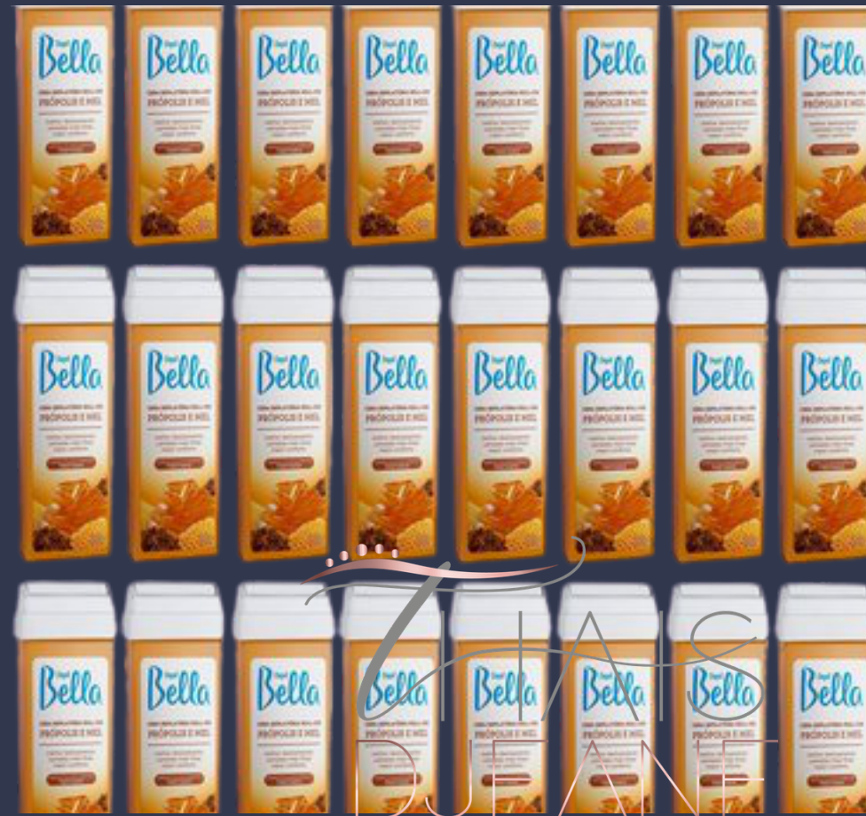
Cera do Método Roll On