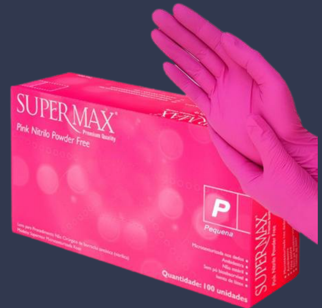
Luva de Nitrilo