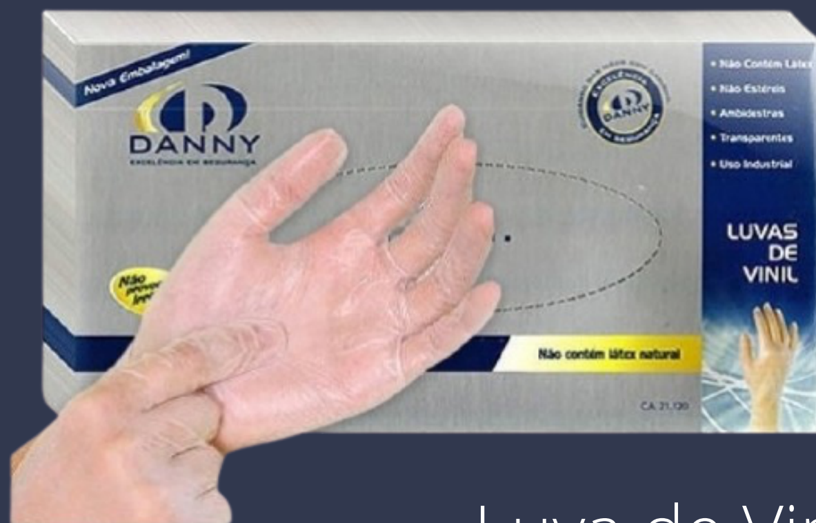
Luva de Vinil

Prefiro as Luvas de Vinil ou Nitrilo por não fixar cera nelas, torna mais FÁCIL na hora de depilar.